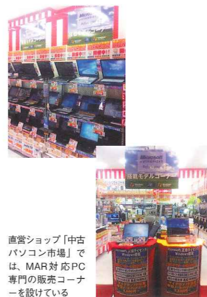
直営ショップ「中古パソコン市場」では、MAR対応PC専門の販売コーナーを設けている

創業当時、高齢者向けのPC教室を開いていた同社にとって、PCについてあまり詳しくない初心者でも安心して購入できる中古PCを安価で販売することは、現在においても、もっとも重視している点だ。中古でありながら正規のサポートが受けられ、セキュリティ上も安心感のあるMARプログラムへの参加は、同