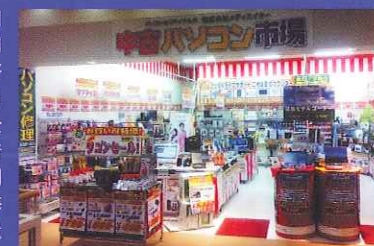
直営ショップは福岡だけで9店舗。2007年以降は全国展開を進めている

2003年に福岡県で創業。専門用語を使わない接客、価格帯や用途別の売り場構成で初心者にも好評の直営ショップ「中古パソコン市場」は、九州を中心に現在全国で22店舗を数える。地域密着をモットーに、修理対応や個別の出張サービス、買い取りや修理専門のサイトの運営など、量販店では難しいきめ細かいサービスを提供している。